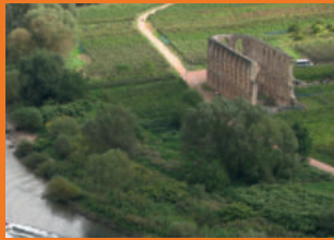
Kloster ruine Stuben